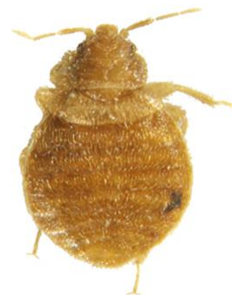
Svaletege Oeciacus hirundinis