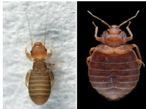
Foto Støvlus: Tom Murray via BugGuide , lisens CC BY-ND-NC 1.0 Foto veggedyr: Gilles San Martin via Flickr, lisens CC BY-SA 2.0.