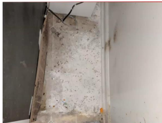
En hel boks med maurpulver - kjøpt utenlands