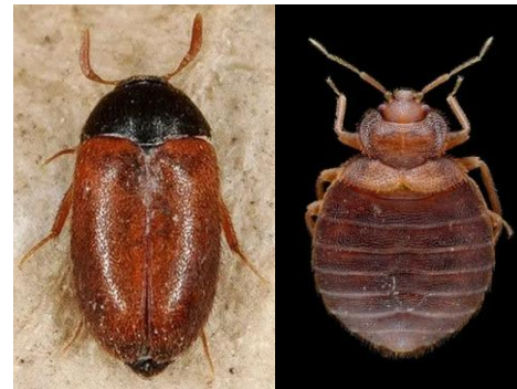
Foto veggedyr: Gilles San Martin via Flickr, lisens CC BY-SA 2.0.