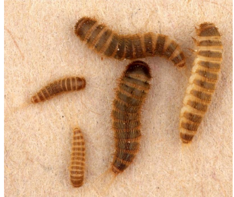
Larver av brun pelsbille Attagenus smirnovi