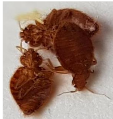
Foto: Flaggermustege Cimex pipistrelli Kari Rigstad, Lisens: CC BY-SA 4.0