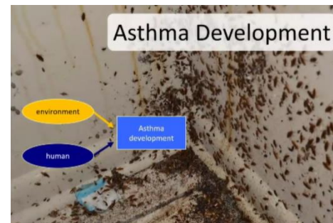
Bilde fra PCT webinar